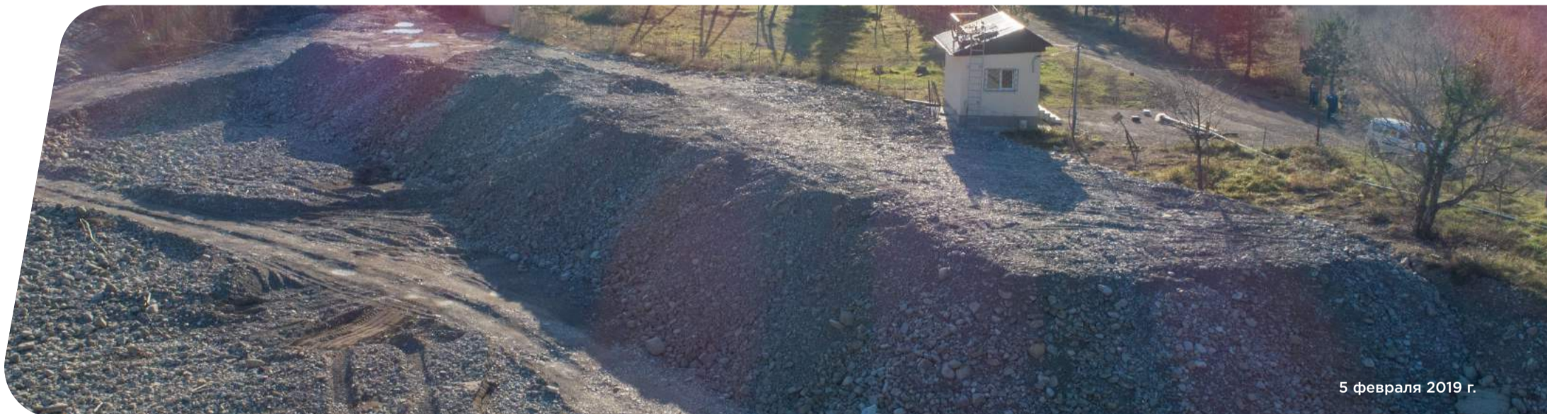
5 февраля 2019 г.

Сочинский водоканал снизил потребление реагента на очистных