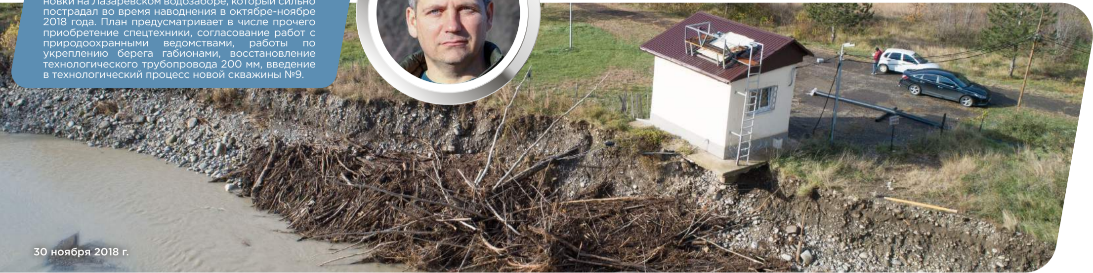
30 ноября 2018 г.

Согласно опубликованным в научной печати прогнозам Сочинского научно-исследовательского центра «в ближайшие годы в горных и предгорных районах Северного Кавказа усилится риск катастрофических наводнений, которые чреваты риском для населения и значительным экологическим и экономическим ущербом». Следует также ожидать увеличения объема селей - на 20-30% от среднего объема в XX веке; вырастет продолжительность селеопасного периода. С фактом климатических изменений необходимо считаться при разработке сценариев социально-экономического развития районов